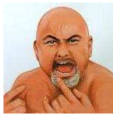
フロレスラー 武藤 敬司

もしこのまま髪が減り続けたらフロレスラーの武藤敬司さんみたいに髪を剃り上げてヒゲを伸ばそうか。イメージチェンジして、このカメまんねんの顔写真も差し替えようか、との考えも頭をよぎりました。